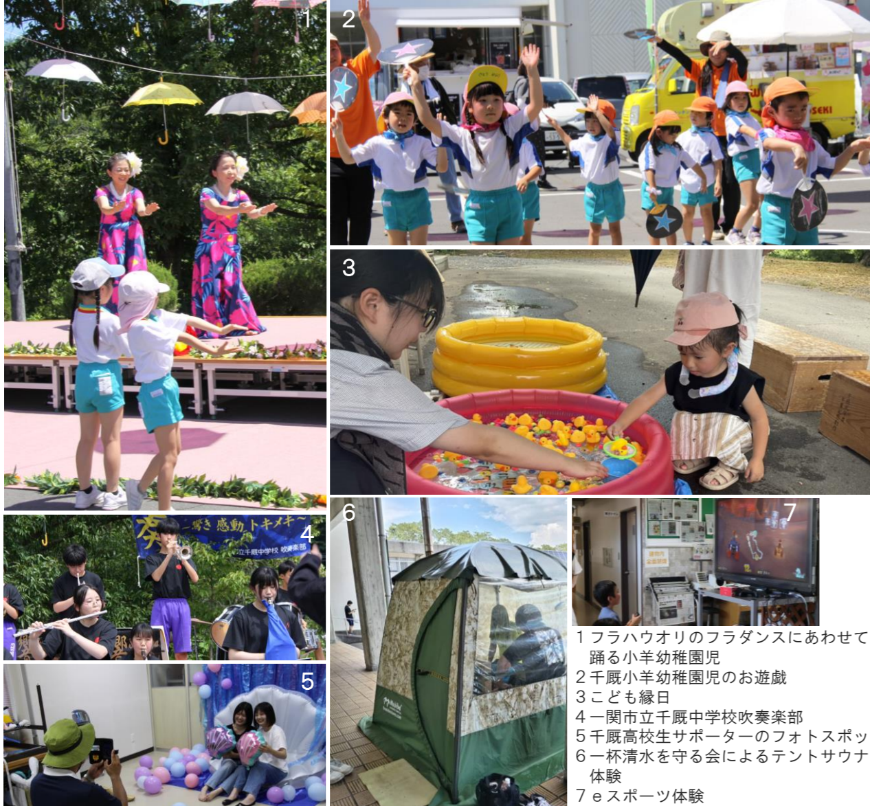
1 フラハウオリのフラダンスにあわせて踊る小羊幼稚園児 2 千厩小羊幼稚園児のお遊戯 3 こども縁日 4 一関市立千厩中学校吹奏楽部 5 千厩高校生サポーターのフォトスポット 6 一杯清水を守る会によるテントサウナ体験 7 eスポーツ体験